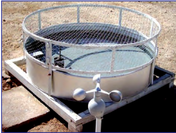
شکل ۶- تشتک تبخیر کلاس A برای تنظیم دورآبیاری در داخل مزرعه چغندر قند