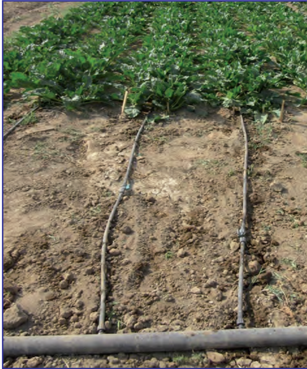
شکل ۹- آرایش کاشت و آرایش نصب نوار آبیاری قطره‌ای در مزرعه چغندر قند