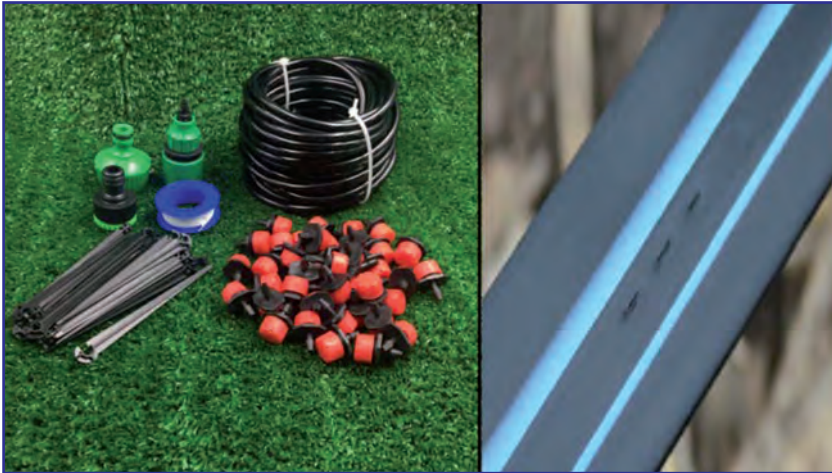
شکل ۲- نوار آبیاری قطره‌ای و ضمائم آن