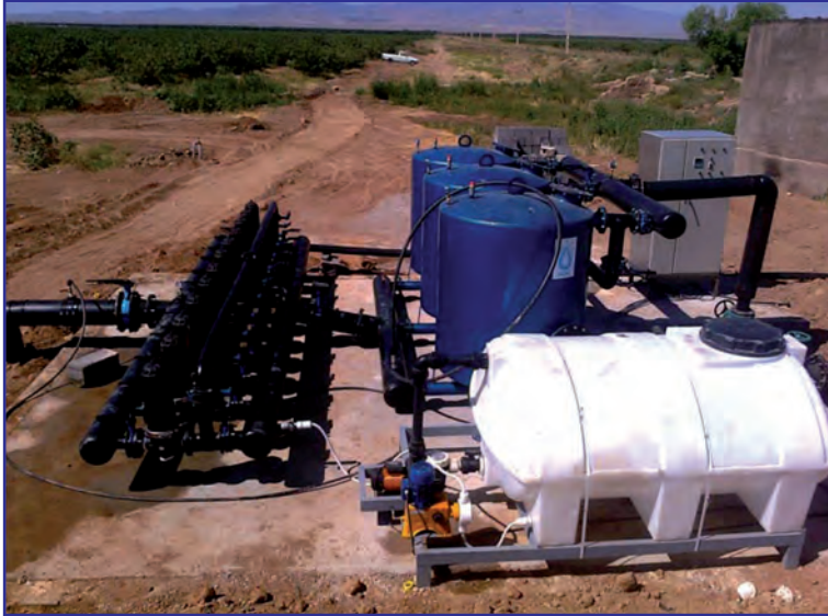
شکل ۱۰- تانک کود برای استفاده از کود آبیاری در مزرعه

دو آبیاری در میان در چهار تا پنج بار پس از مرحله تُنک مصرف کرد. با این روش هم هزینه‌های تولید کم‌تر می‌شود و هم آلودگی محیط‌زیست بر اثر مصرف زیاد کود نیتروژن کاهش می‌یابد.