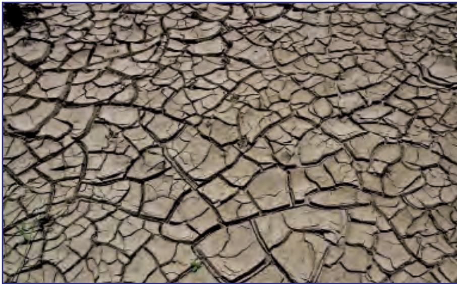
شکل ۱- سله ایجاد شده در خاک

با استفاده از روش آبیاری قطره‌ای - نواری به دلیل توزیع یکنواخت رطوبت و فاصله‌های کوتاه آبیاری، "سله" که معمولاً در آبیاری سطحی عامل بدسبزی در مزارع است ایجاد نمی‌شود (شکل ۱).