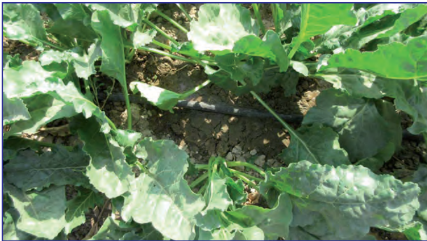
شکل ۴- رطوبت مطلوب اطراف ریشه گیاه

یکی دیگر از مزایای روش آبیاری قطره‌ای - نواری فراهم کردن شرایط مطلوب رطوبت در مدت‌های طولانی در اطراف ریشه است؛ بنابراین گیاه طی فصل رشد، با وجود صرفه‌جویی در مصرف آب در معرض تنش خشکی قرار نمی‌گیرد (شکل ۴).