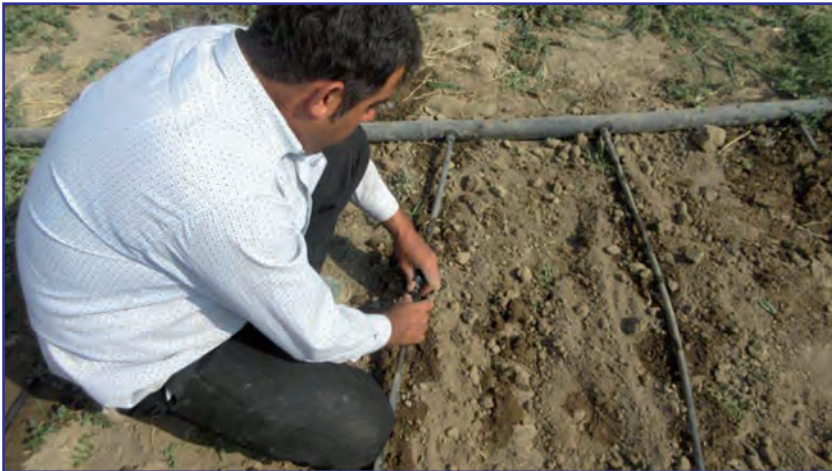
شکل ۳- طریقه نصب نوارهای آبیاری