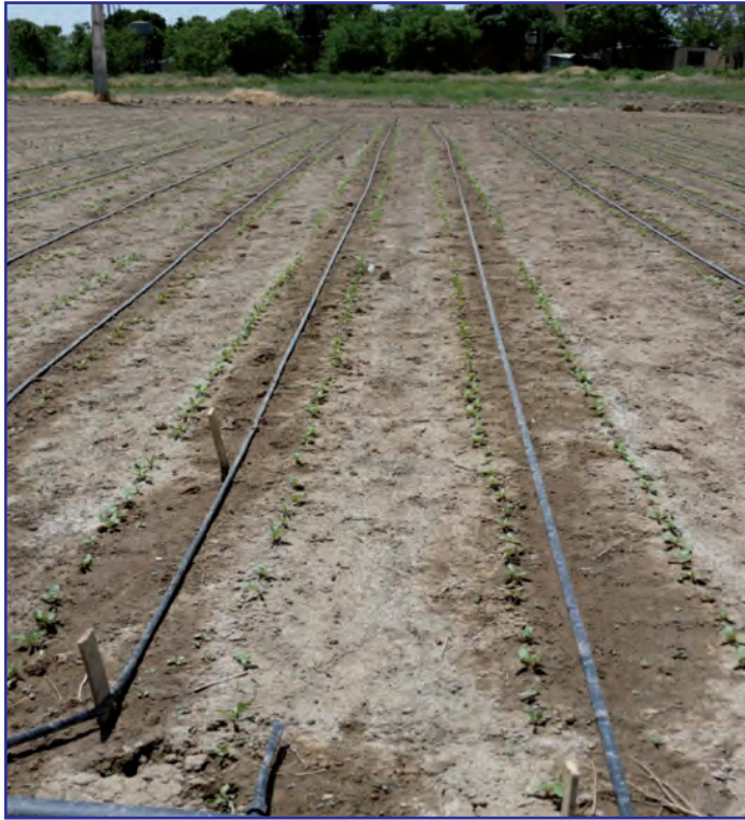
شکل ۵- سبز شدن بذرها در روش آبیاری قطره‌ای- نواری در زراعت چغندر قند